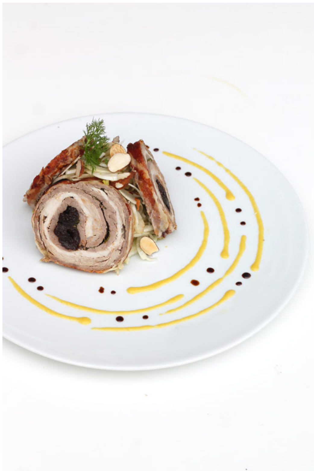
ARROSTO AGRODOLCE per 4 persone

tanti elementi con cui comporre il piatto. Non so se ho fatto un lavoro all'altezza del contest ma come primo esperimento mi ritengo personalmente piuttosto soddisfatta!!!