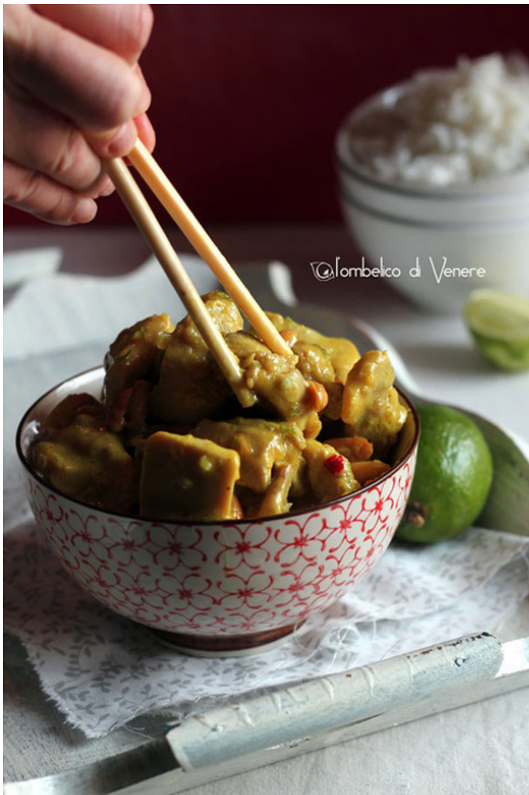
Qualche ricordo di Ayutthaya