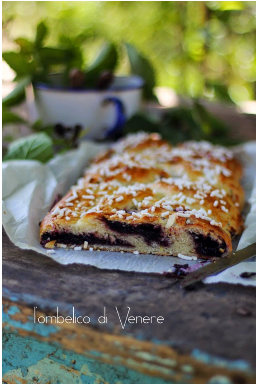
l'ombelico di Venere