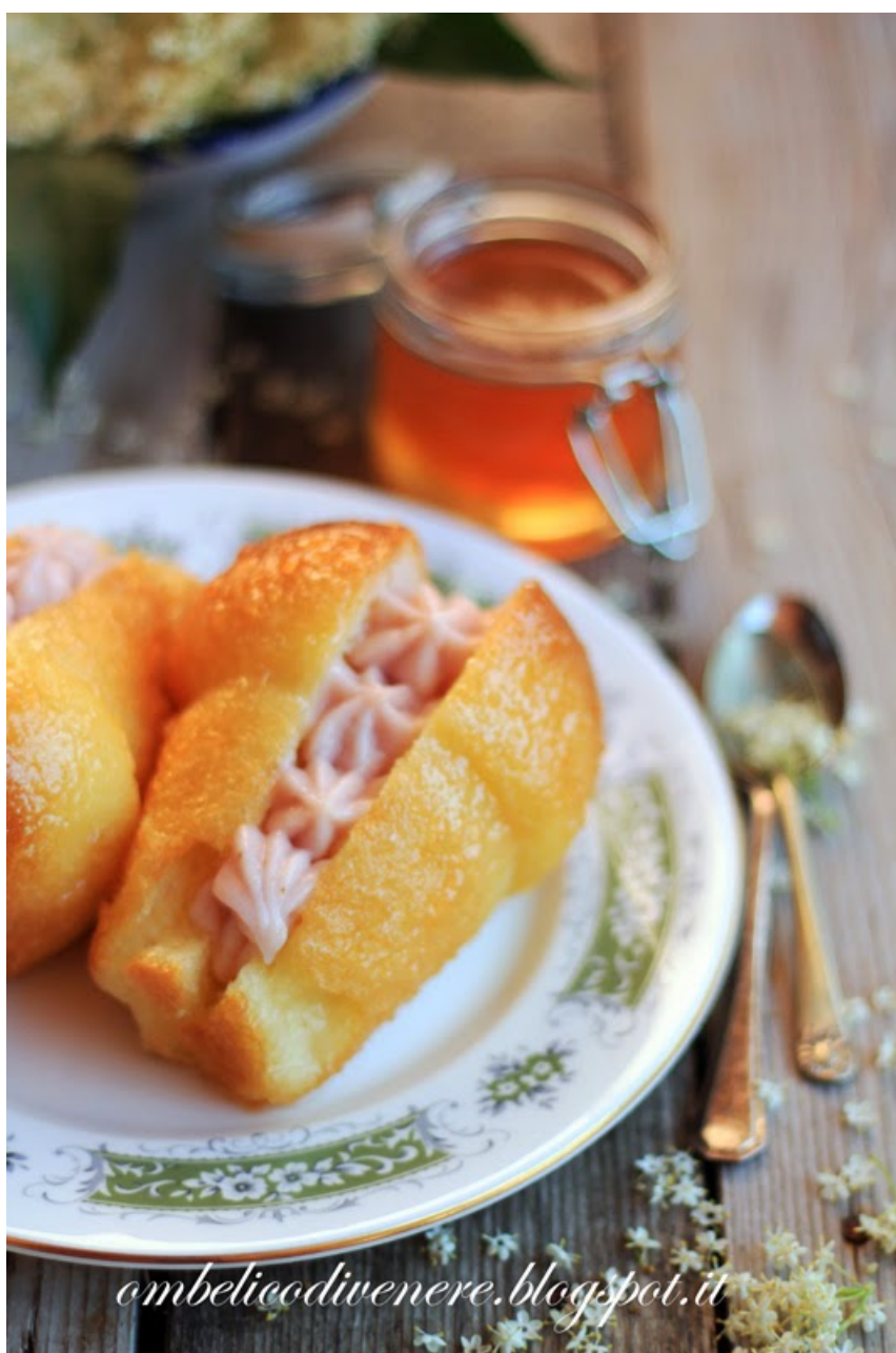
BABA' AL SAMBUCO CON CREMA BIANCA ALLA FRAGOLA

lasciarmi un pensiero ma al di là delle parole sulla ricetta mi hanno fatto piacere i complimenti rivolti alla persona, quindi grazie davvero delle tue parole, anche io sono felice di averti incontrata, e di aver incontrato il tuo babà!! Anche questa versione si è rivelata ottima, più delicata della prima. Ho scelto una crema dal sapore soft e non molto dolce per fare in modo che nessun sapore copra gli altri. Volendo però si può aumentare la quantità di sciroppo alla fragola di un paio di cucchiaini, mettendone di più bisognerà riconsiderare la quantità di farina per non avere una crema troppo liquida. La gelatina allo zenzero dona quel saporino leggermente piccante che rimane in bocca dopo aver mangiato il babà, a mio gusto ci stà proprio bene!