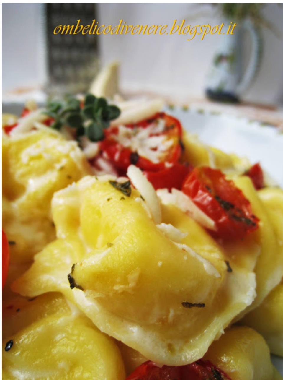
CAPPELLETTI RICOTTA E RAVIGGIOLO CON POMODORINI CONFIT E SALSA DI FOSSA